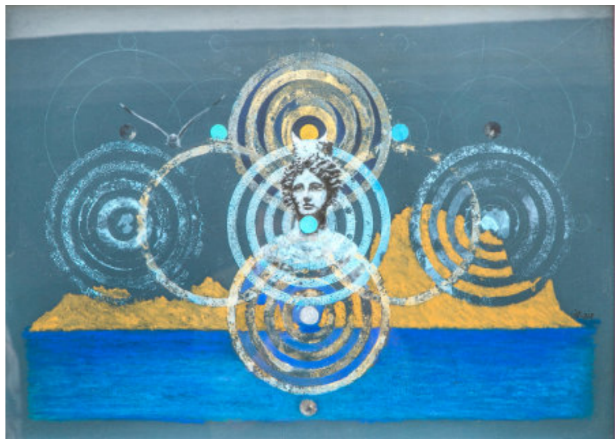
Técnica mixta/papel 51,5x72 cm