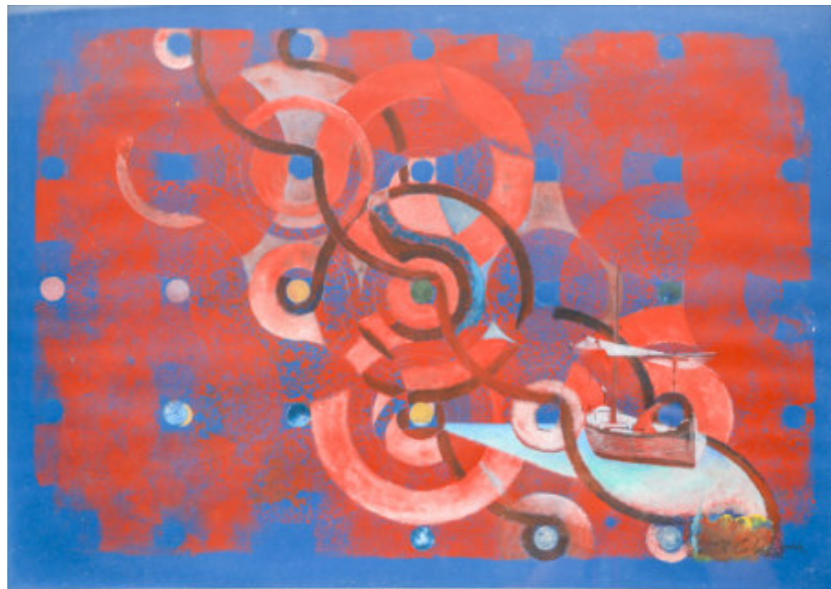
Técnica mixta/papel 50x65 cm