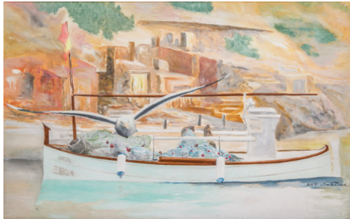
Acrílico sobre tela 150x100 cm