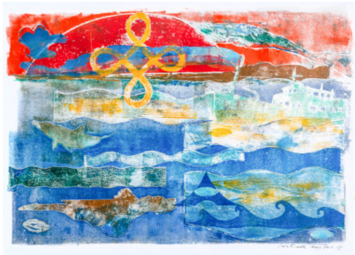
Técnica mixta/papel 50x65 cm