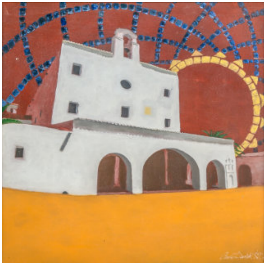
Acrílico sobre tela 100x100 cm