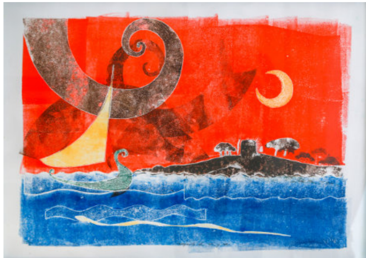
Técnica mixta/papel 50x65 cm