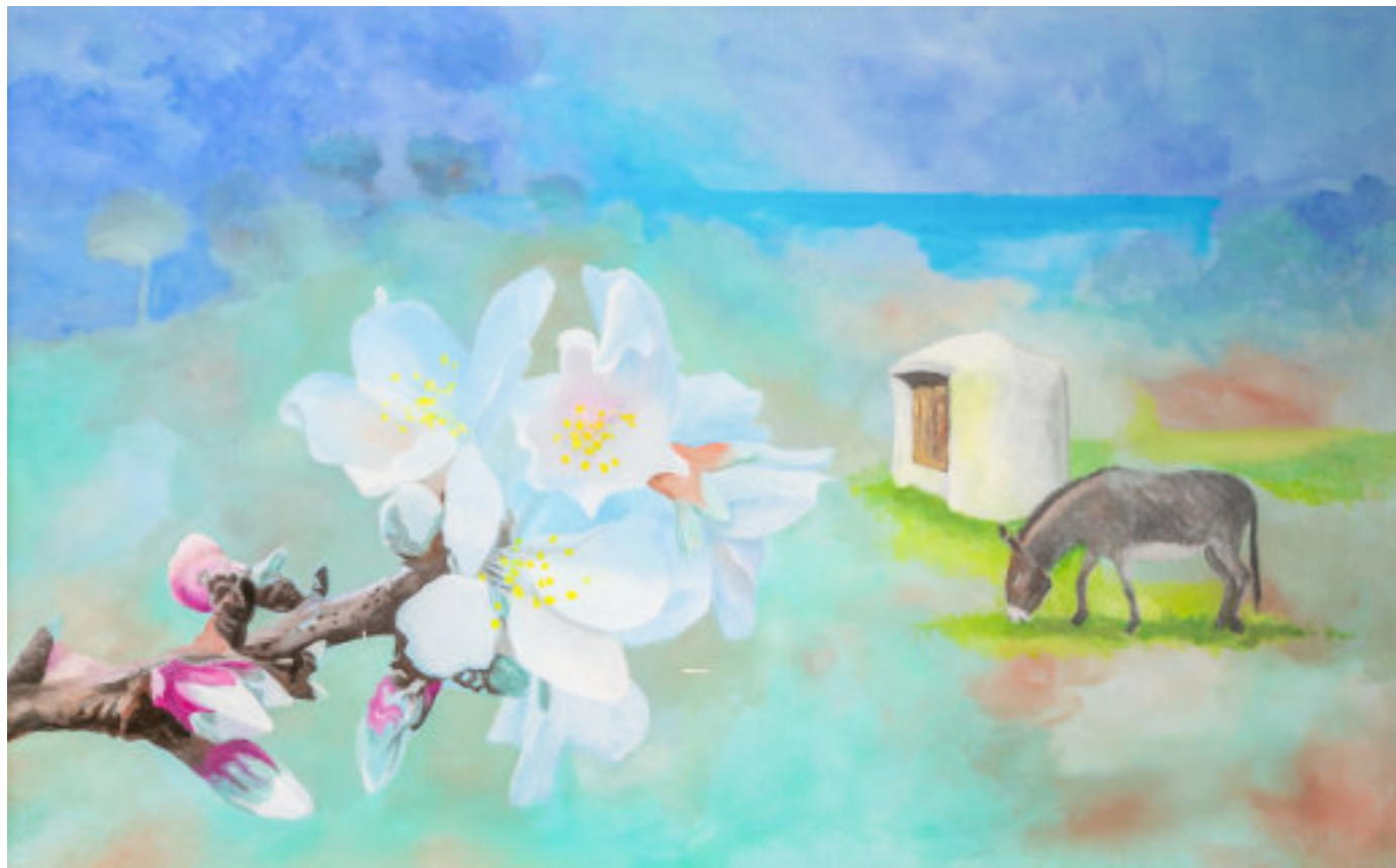
Acrílico sobre tela 150x100 cm