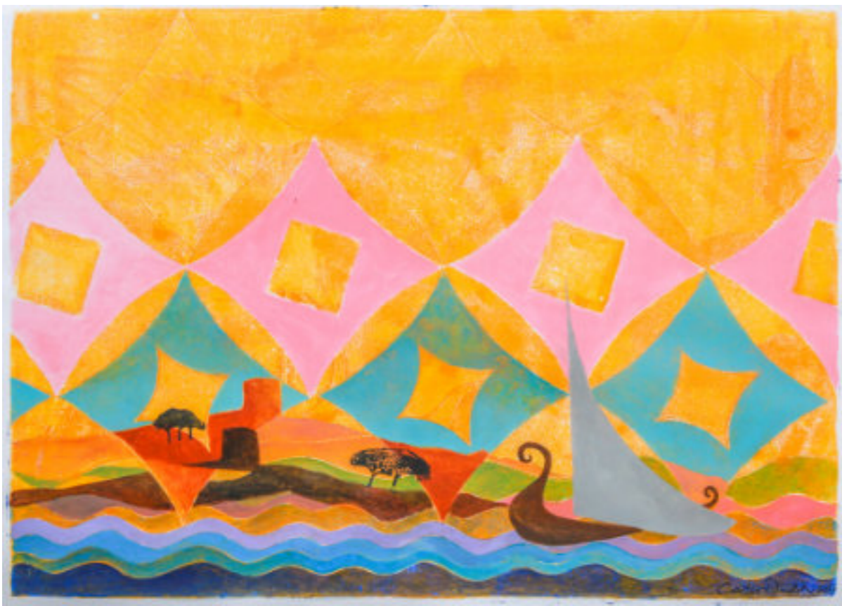
Técnica mixta/papel 50x65 cm