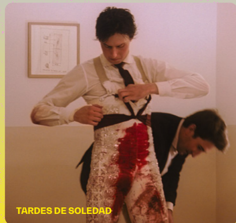
TARDES DE SOLEDAD

■ Retrat d'una estrella del toireig en actiu, Andrés Roca Rey, que permet reflexionar sobre l'experiència íntima del torero que assumeix el risc d'enfrontar-se al toro com un deure personal per respecte a la tradició i com un desafiament estètic. Aquest desafiament crea una forma de bellesa efímera a través de la confrontació material i violenta entre la racionalitat humana i la brutalitat de l'animal salvatge.